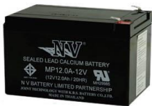
แบตเตอรี่ ชนิดแห้ง 12V12Ah