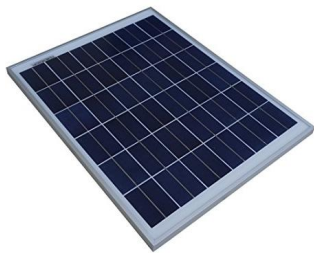
แผงเซลล์แสงอาทิตย์ กำลังไฟฟ้า 20W